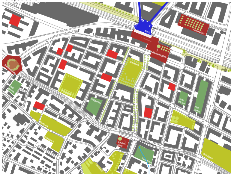
Multifunktionale öffentliche Freiräume im Zentrum von Altstetten