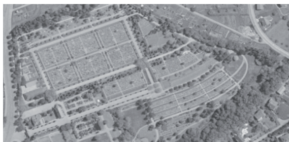
Orthofoto 1951