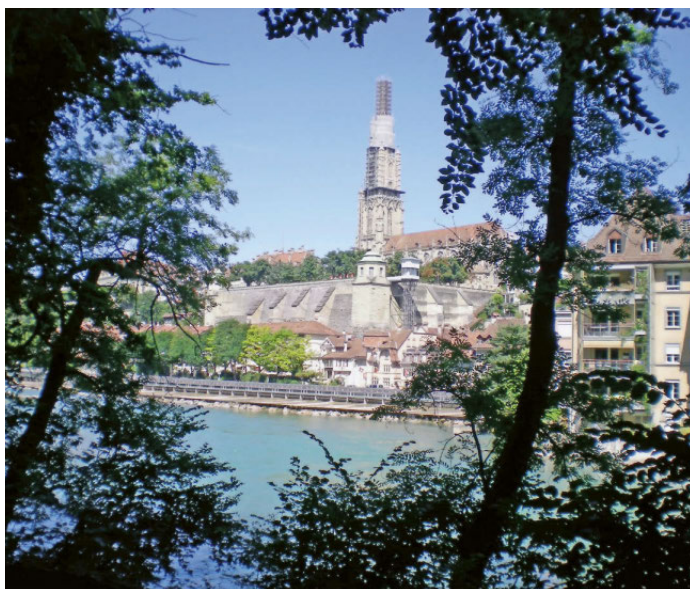
Heutiges Sichtfenster ausgehend von der Promenade auf die Altstadt von Bern, Englische Anlage 2015

Als Grundlage für die Arbeit am neuen Waldbild wurden der aktuelle Waldbestand sowie die natürlichen und potenziellen Waldgesellschaften beschrieben. Eine Bauminventur wurde erstellt und dabei gegen 300 Bäume kartiert. Bäume mit grossem Stammdurchmesser, wenig vertretene Baumarten, spezielle Wuchsformen, Habitat- und Wegrandbäume wurden aufgenommen und sind vor Ort markiert.