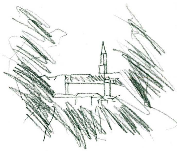
Skizze für das Projekt «Englische Anlage»: Oben offene Sichtfenster von der Promenade aus sollen auch in Zukunft landschaftliche Strukturelemente bilden.