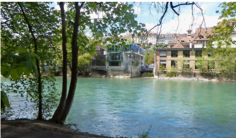
Wesentliche landschaftsgestalterische Elemente des Waldbildes werden weiterhin gefördert: (oben) Hell-Dunkel-Kontraste mit dem Efeu und Laub (Mitte) Totholz wird soweit möglich im Wald belassen (unten) Sichtfenster der Promenade in Richtung Altstadt von Bern