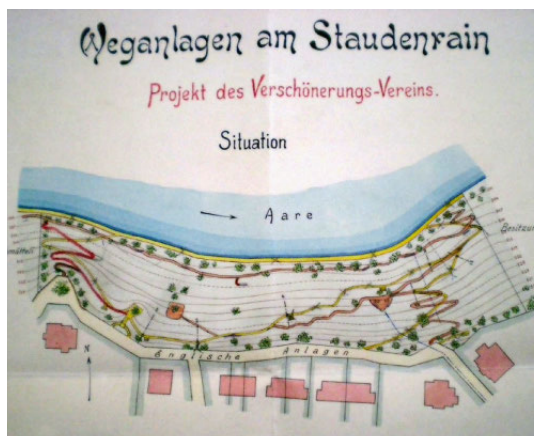
Entwurfsplan für die Gestaltung des Wegenetzes der Englischen Anlage um 1911

Der Verschönerungsverein Bern projektierte und erstellte den heute zentralen Abschnitt in der Halde der Englischen Anlage. Der Entwurf von 1911 sah diverse Waldwege vor, die sich durch das Gelände schlängeln. Die Wege, ein Sitzplatz und der Uferweg wurden angelegt. Die heutige Strasse «Englische Anlage» wurde zusammen mit Plätzen im und am Wald als Promenade 1881 erstellt. Sie ist Teil der beispielhaften Quartierplanung Kirchenfeld, welche die Strassen, die Lage von Gebäuden, die Plätze und weitere Erholungsanlagen im damals neuen Quartier festlegte. Die Bebauung des Kirchenfelds wurde mit dem Quartierplan ausgelöst. Durch Zukauf von Land und den Bau neuer Wege wurde die Englische Anlage durch Stadtgrün Bern in den nachfolgenden Jahrzehnten schrittweise erweitert. Heute ist sie aufgrund ihrer städtebaulichen und sozialgeschichtlichen Bedeutung ein schutzwürdiges Baudenkmal.